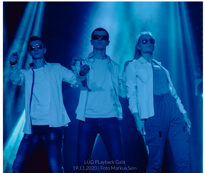
LÜG PLayer Gala 19.11.2020