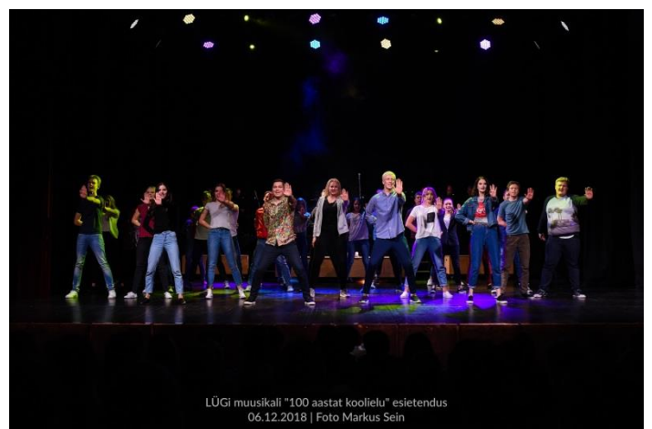
LÜGi muusikal "100 aastat koolile" esietendus 06.12.2018