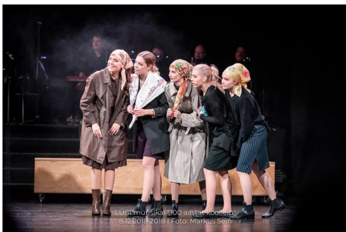
LÜGi muusikal "100 aastat koolile" 8.12.2018 2018

Ausalt öeldes terve see tekst on ülimalt geniaalne, kust välja tuua vaid ühe lemmiku repliigi vms on minu jaoks üpriski võimatu. Märgiksin siiski ära kokatädi Meida ütlused 50ndatest ja 70ndatest, mis olid meeletult naljakad. Nt: "Mina ei ole mingi proua. Ma olen Piirsalust."