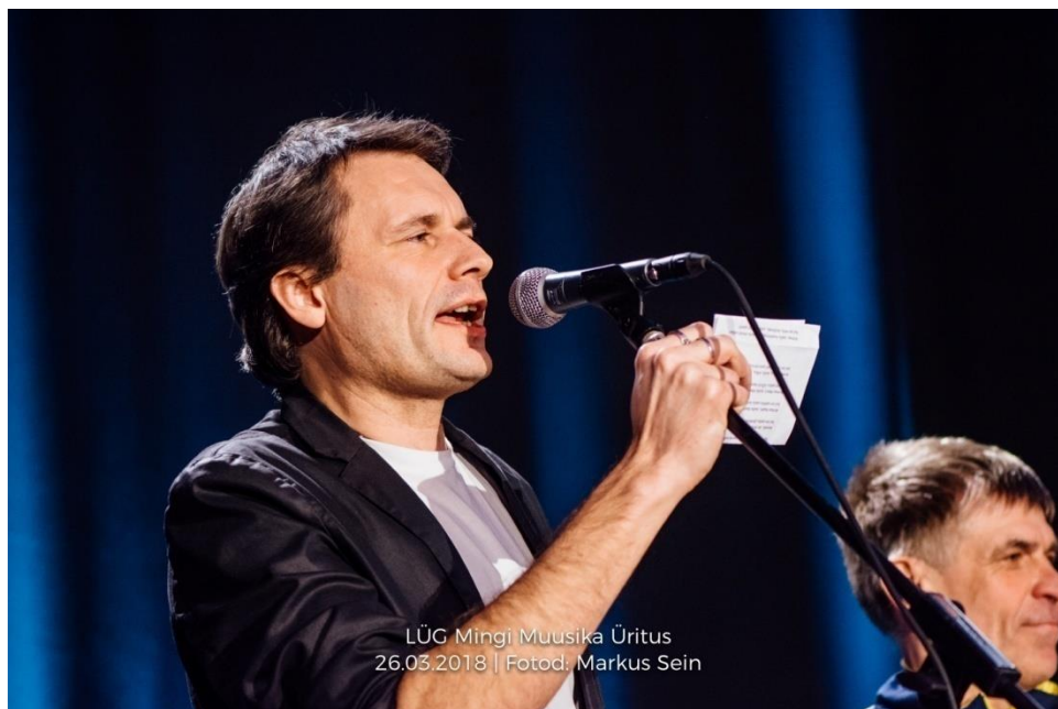
LÜG Mingi Muusika Üritus 26.03.2018

Kuna ma tunde ei anna, siis neid kokkupuuteid ei ole olnud väga palju. Olen üksikutega koridori peal vestelnud ja mõne hilinejaga pikema lause vahetanud. Aga mulle meeldib see, et hommikuti vaatavad ikka valdavalt rõõmsad näod vastu. Ning mis mulle näiteks väga meeldis, oli meie vabariigi aastapäeva aktus. Minu jaoks oli see väga võimas, kuid ma tean, et siin on aastaid väga tugevad ja vahvad üritused olnud. Ilmselt sinise rahva jaoks on sellised üritused juba tavapäraseks kujunenud. ( Intervjuu toimumise