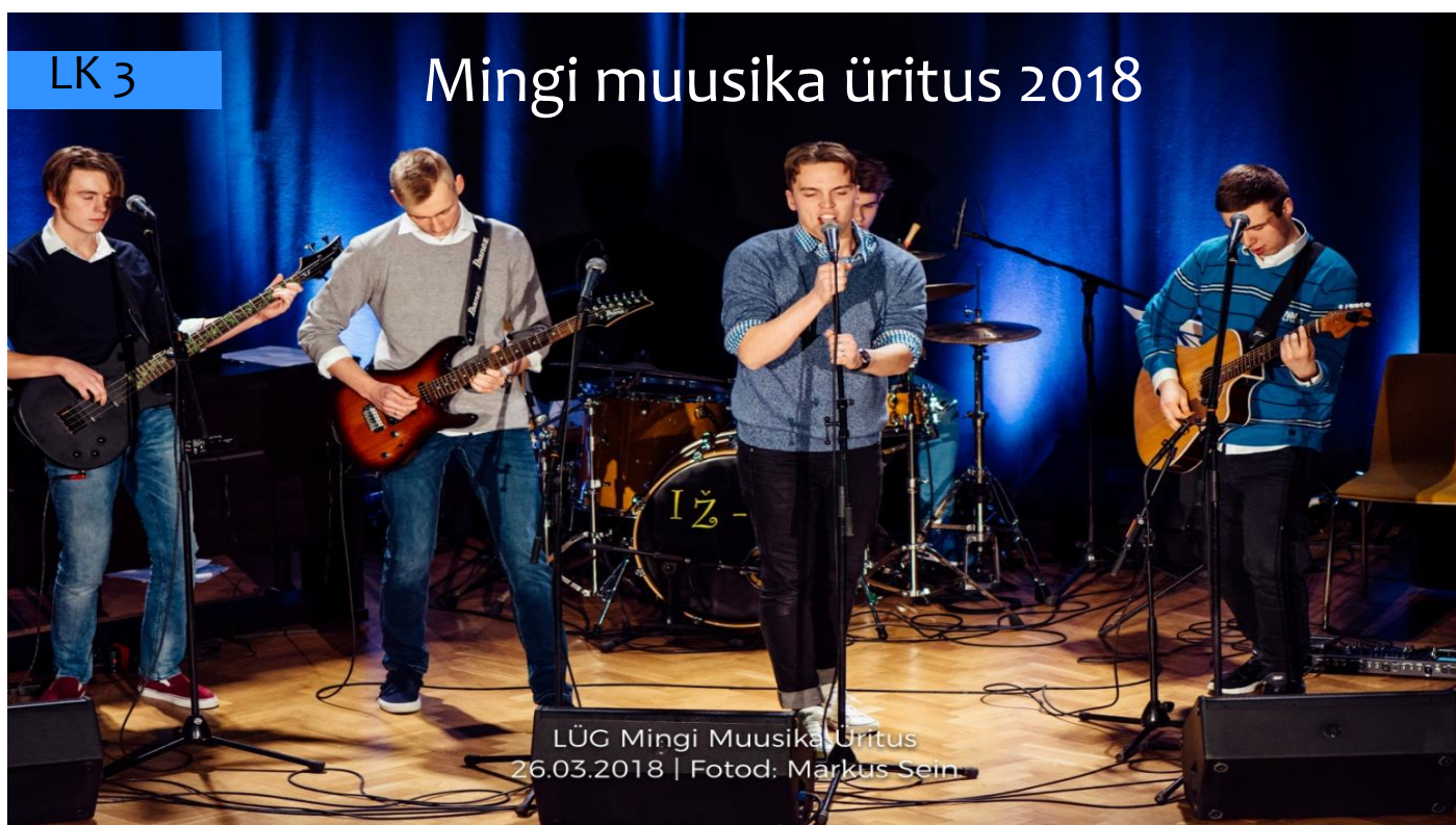
LÜG Mingi Muusika Üritus 26.03.2018