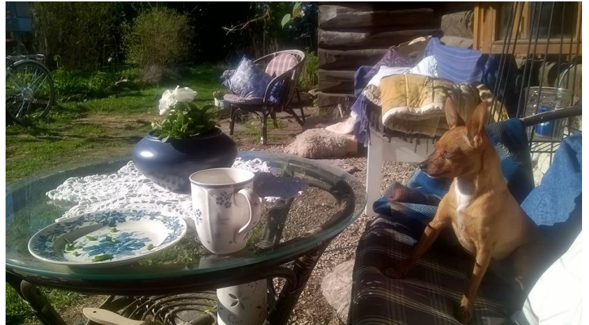
Fotol on koer Täpi oma kodumaja ees päikest ja elu nautimas