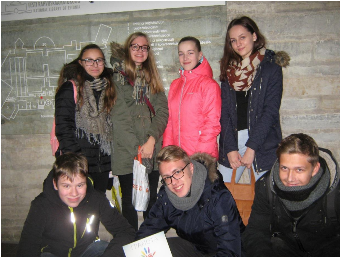
Õpilased Rahvusraamatukogus vene keele festivalil