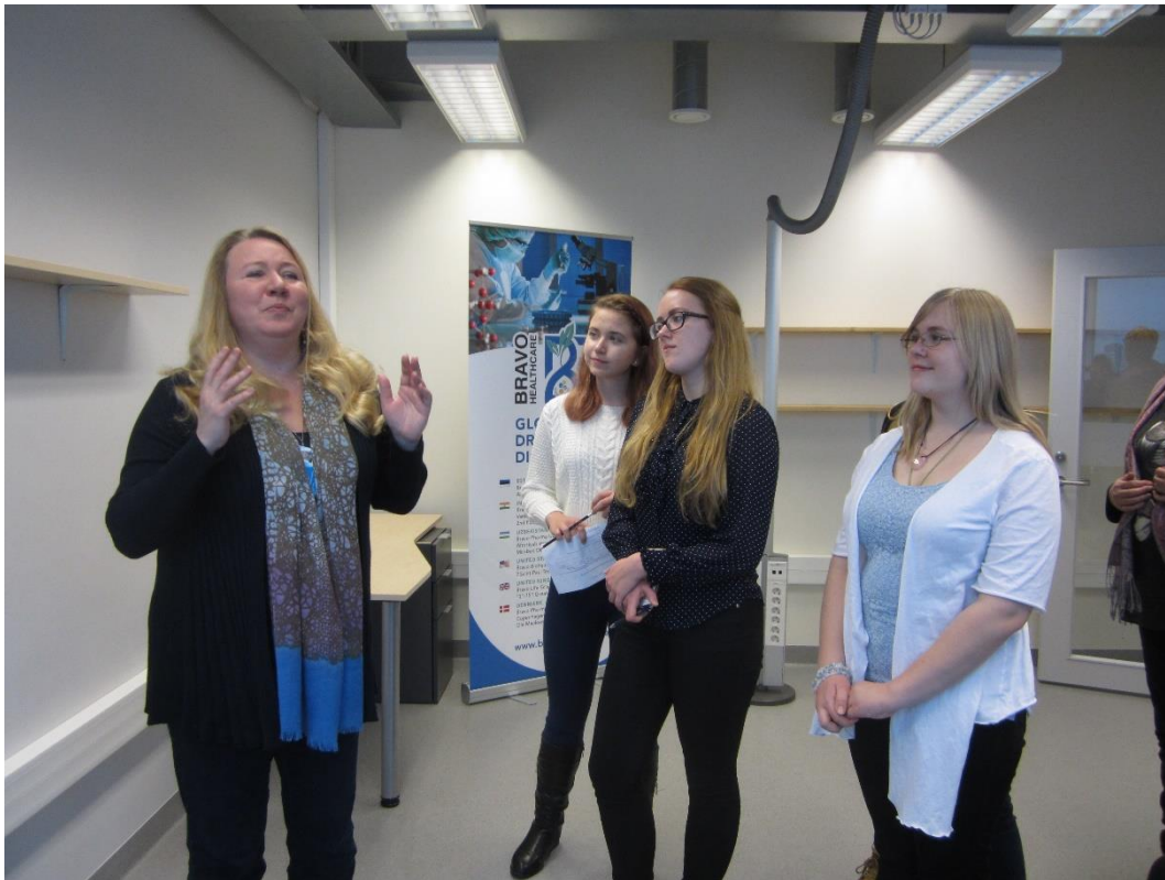
Vähiuuringute Tehnoloogia Arenduskeskuses