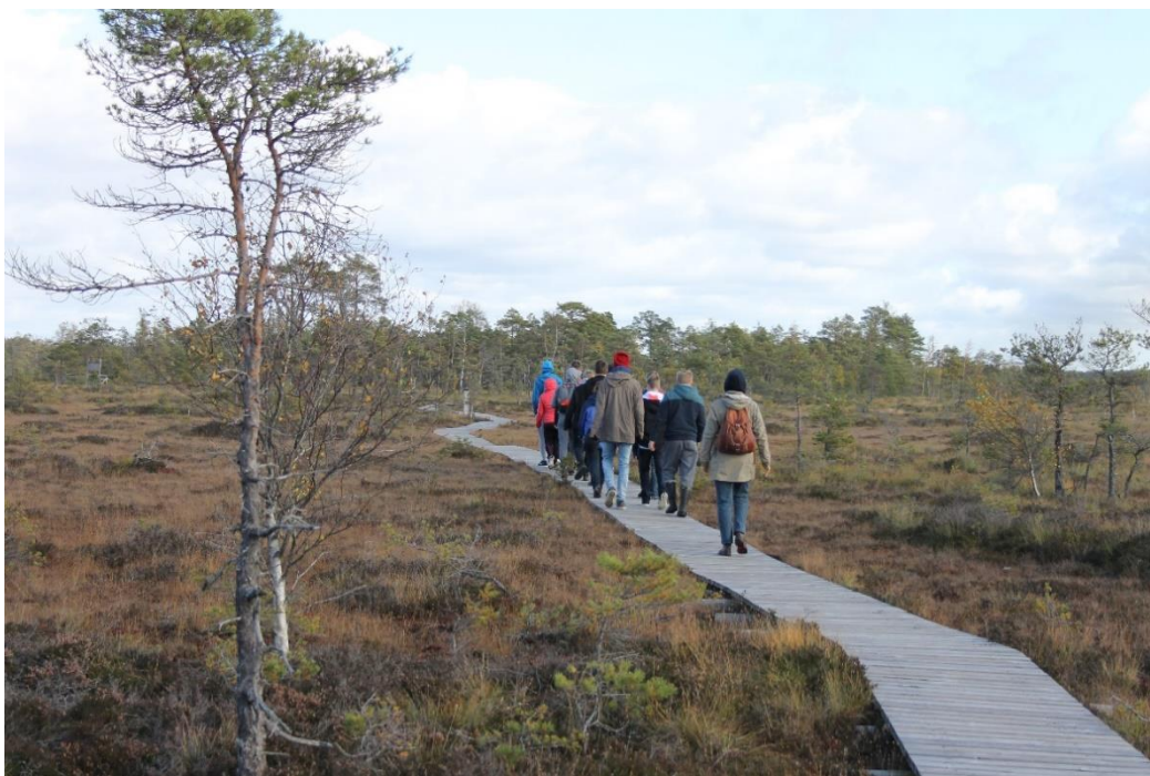
12.R Tolkuse raba matkarajal