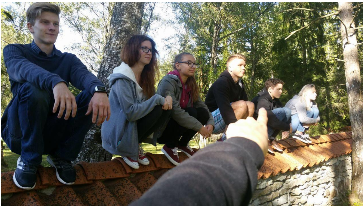
Võlvi laager Tuksis septembris 2016