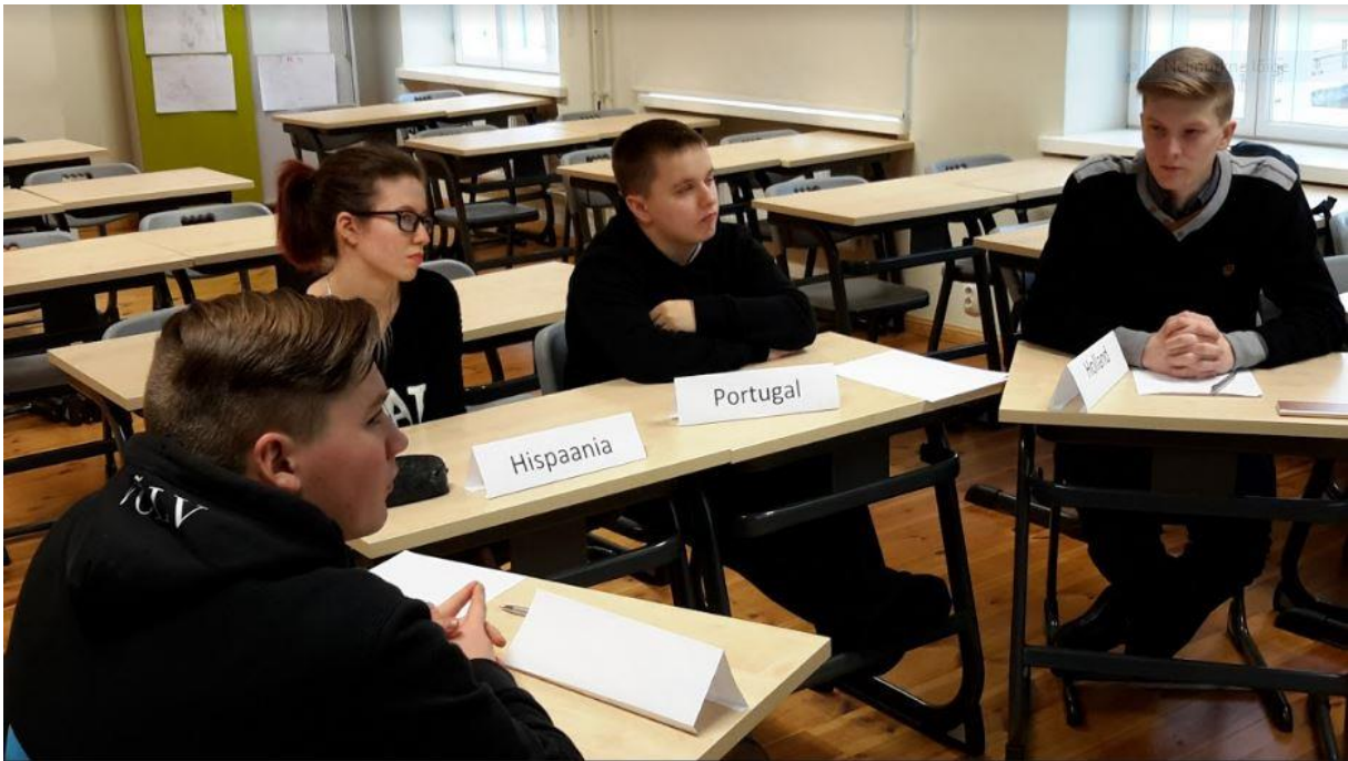
Siseasjade komisjon arutamas Brexiti