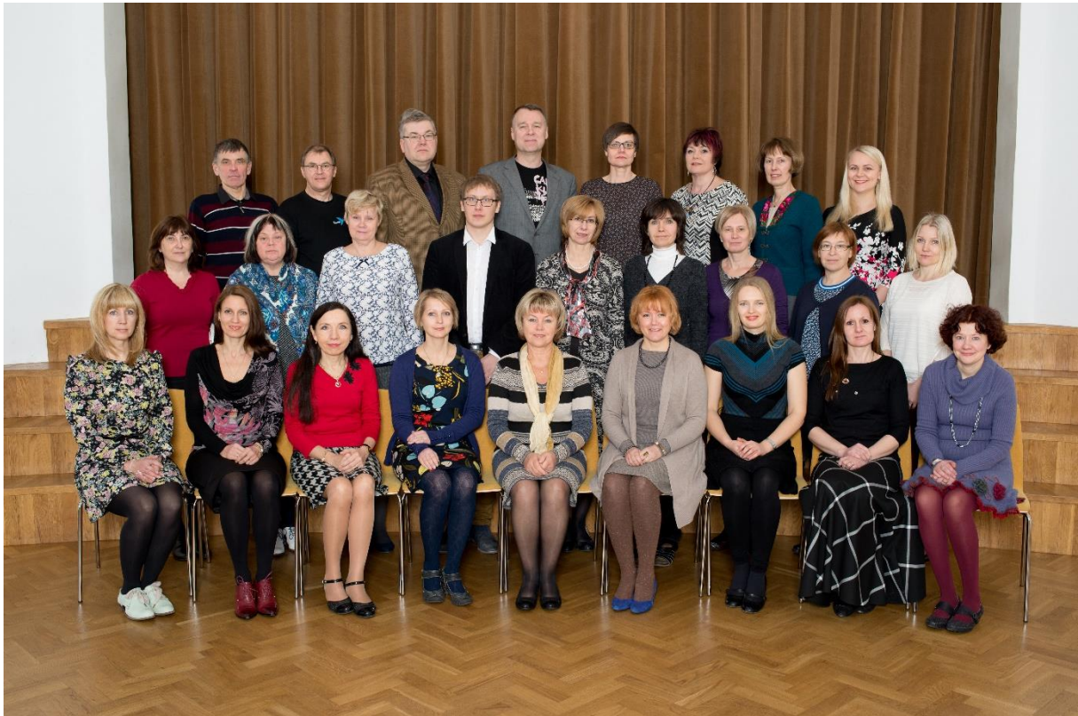
Läänemaa Ühisgümnaasiumi töötajad 2016/2017.