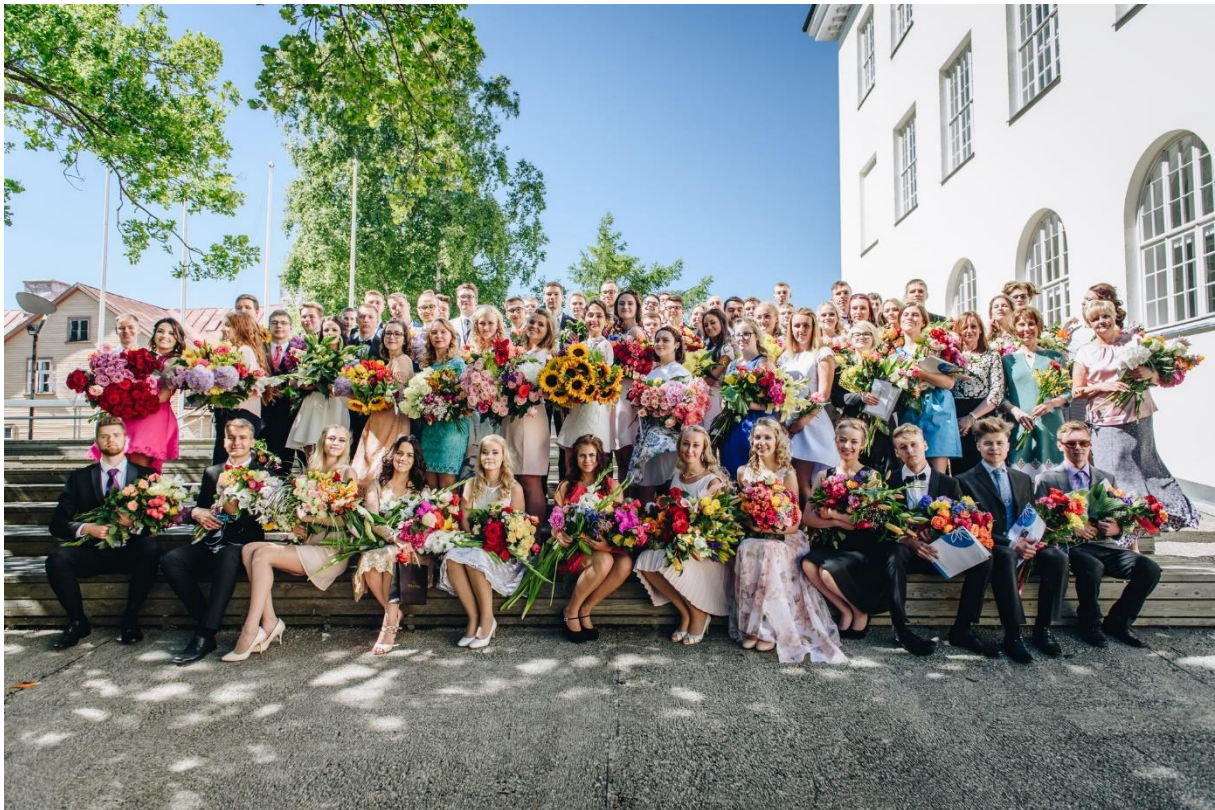
LÜGi lõpetajad 2017.