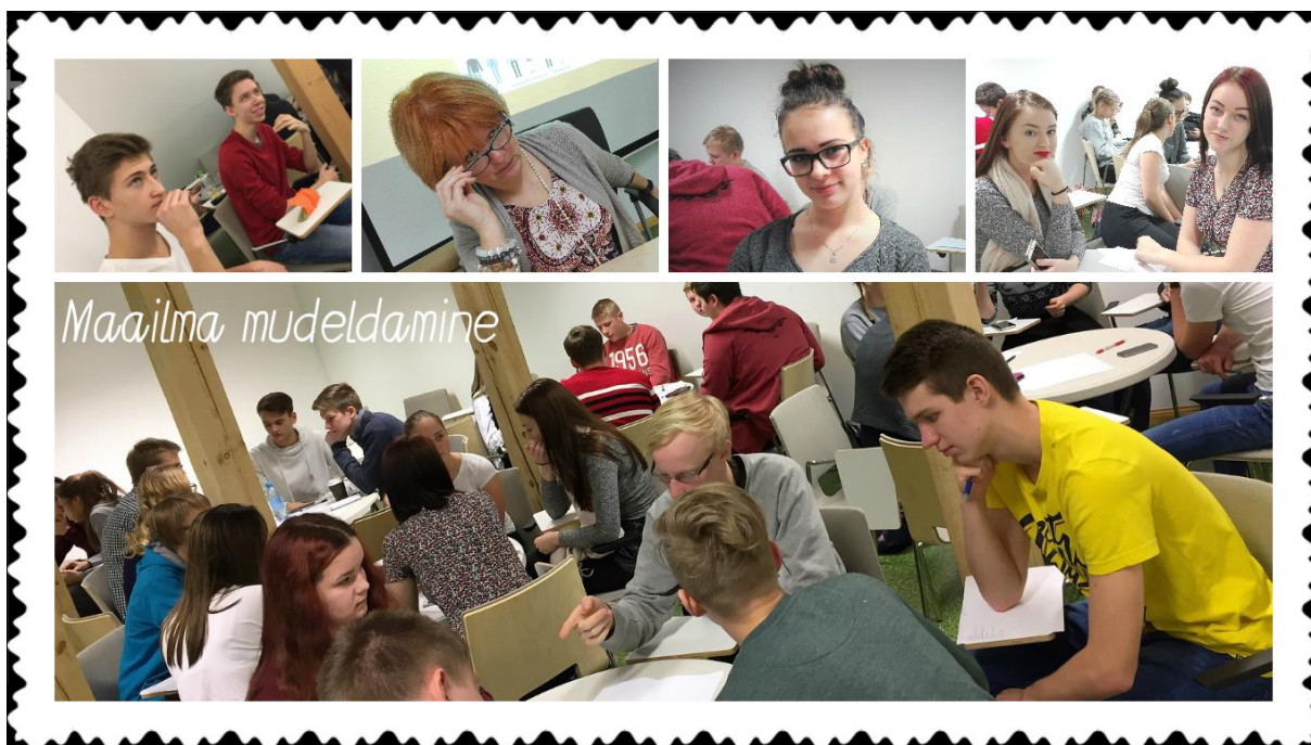
Anette Marilin Villandi fotograafia töötoa kollaaž maailma mudeldamisest