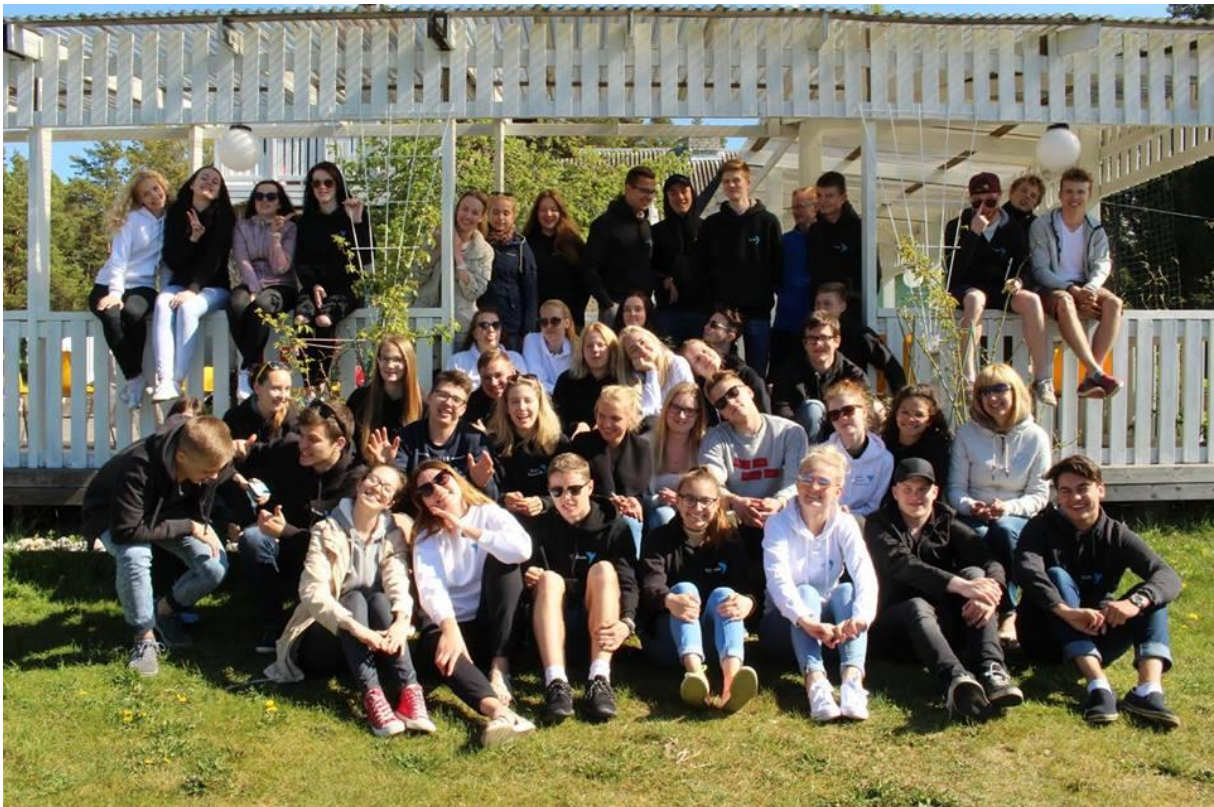
VÕLVi laager Tuksis mais 2017