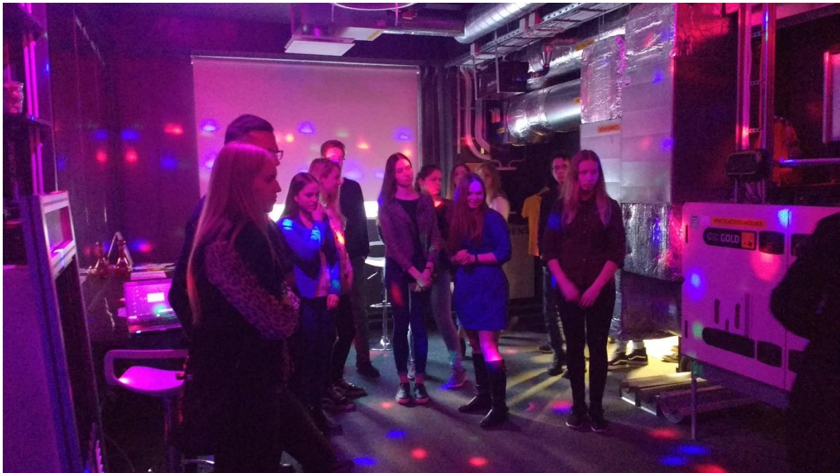
Ekskursioon Mektory keskuses