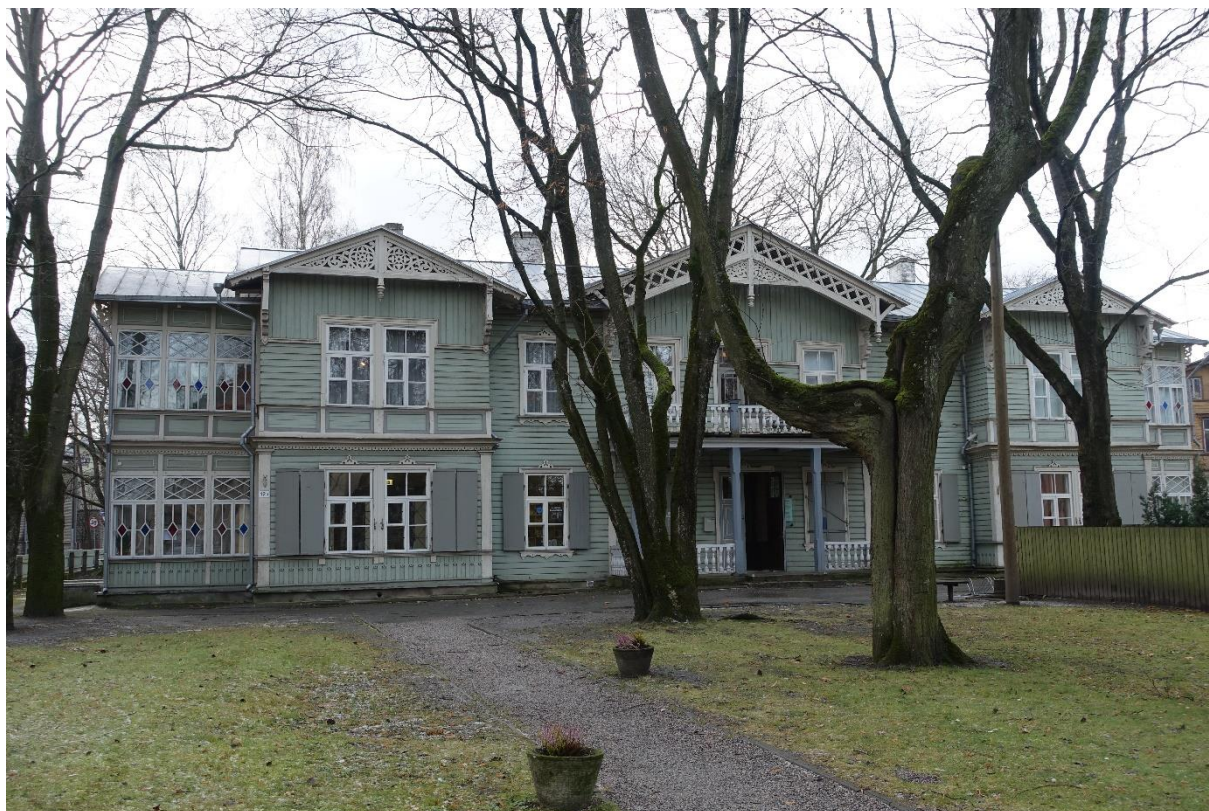
Tammsaare korter Kadriorus