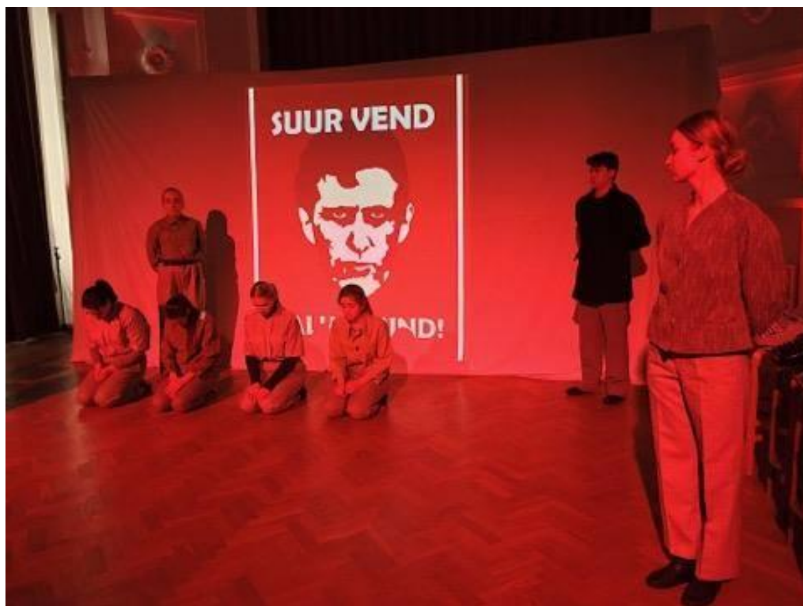
LÜGi draamaring „Või Midagi Sellist” – „Tõmin”