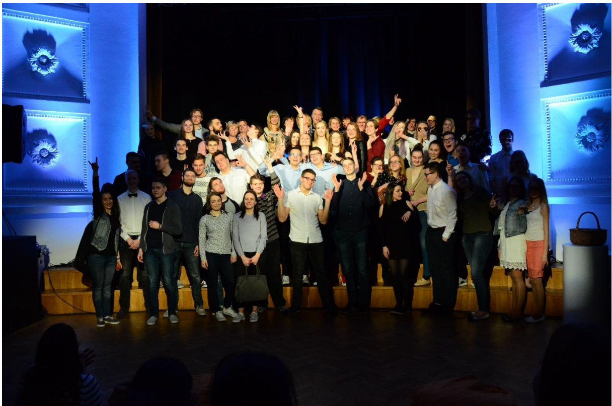
Mingi Muusika Ürituse esinejad