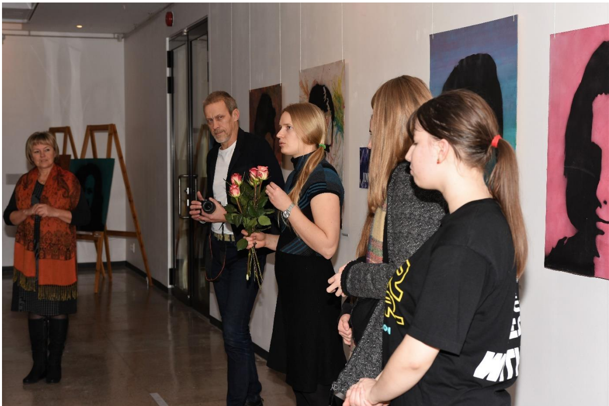
Näituse avamisel.

Refereeritud Kaire Reiljani Lääne Elu artiklist „Gümnasistid teevad näitusega kummarduse Andy Warholile“ 27.01.17.