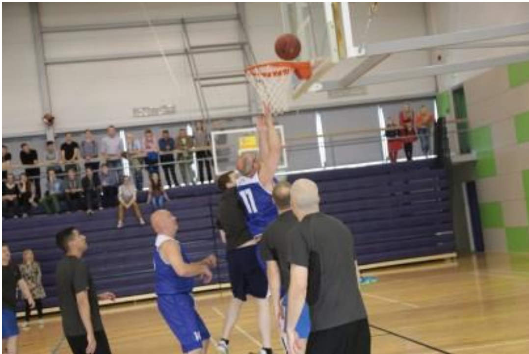
Korvpallimäng USA saatkonna ja Haapsalu linna – LÜGi esinduse vahel