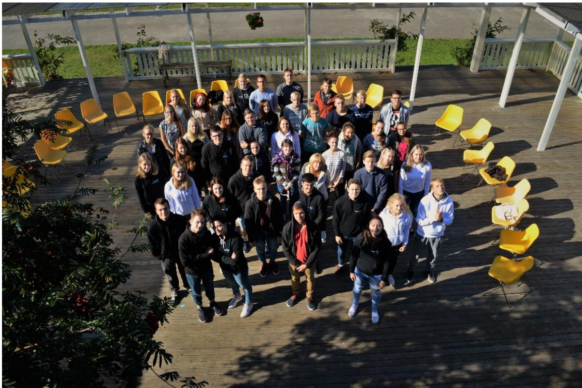
Võlvi laager Tuksis septembris 2016