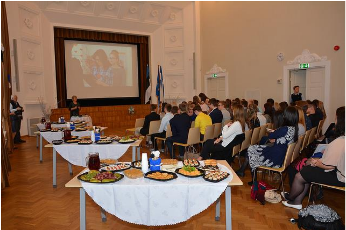
Direktori vastuvõtt 2017