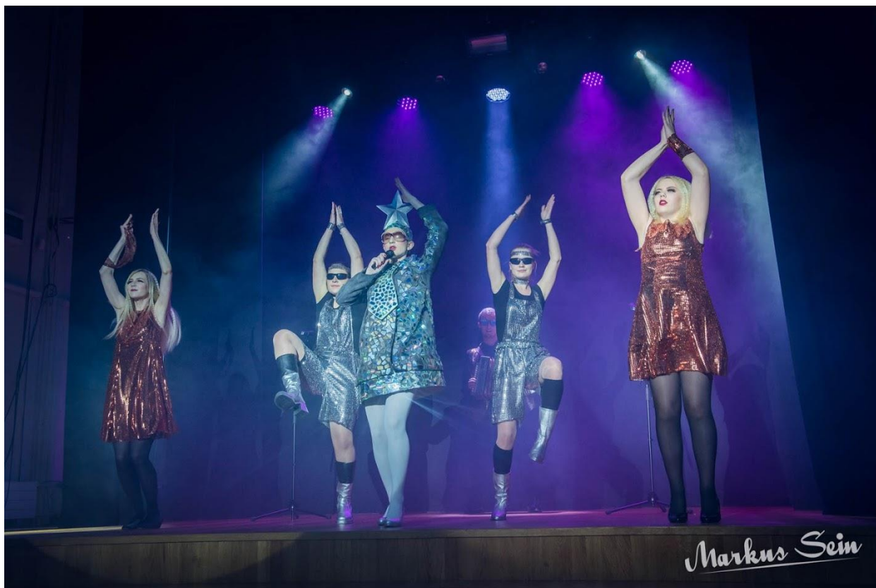
III koht, 11.R ja Verka Serduchka „Dancing Lasha Tumbai“.