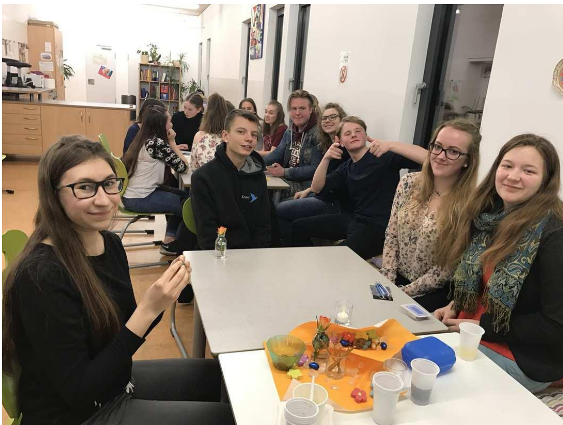
Saksamaa. Wolfsburgi konverentsil