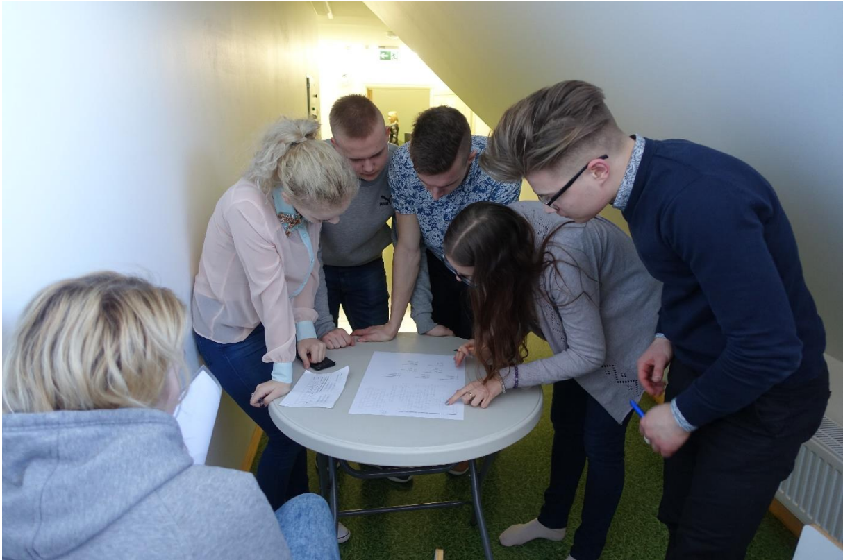
12.M klassi võistkond võõrkeeltemängus ristsõna lahendamas