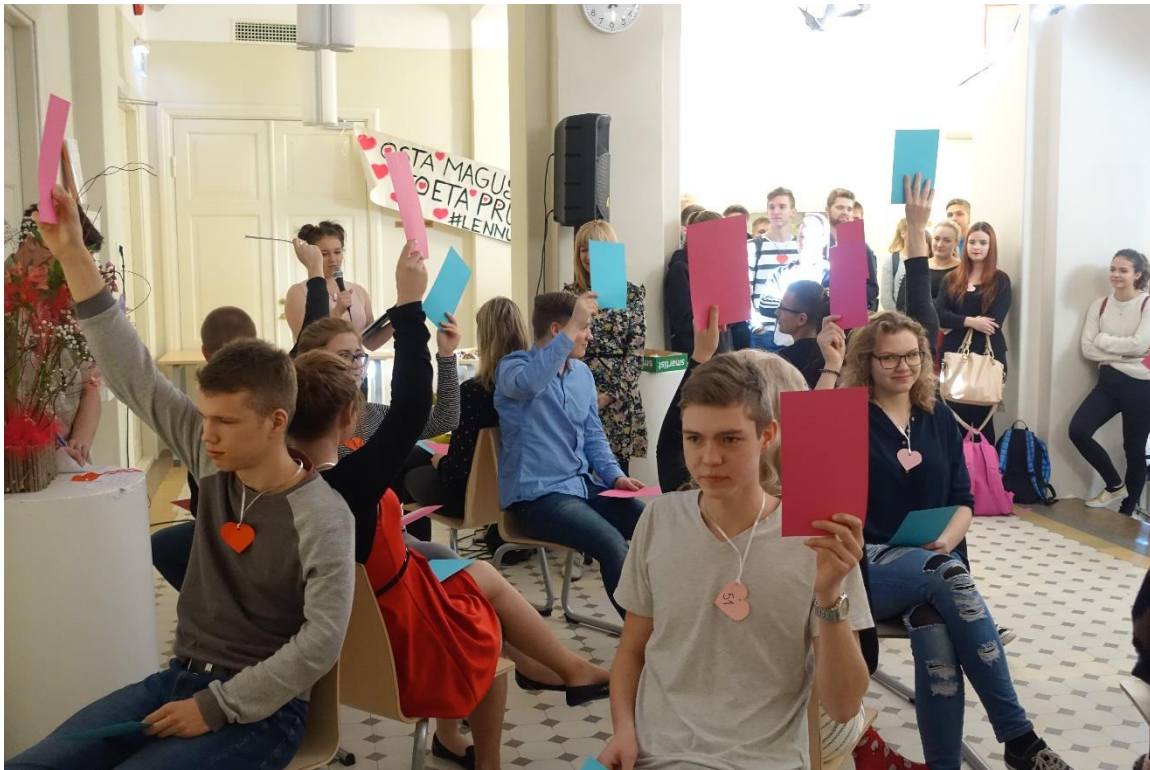
Paaride mäng fuajees