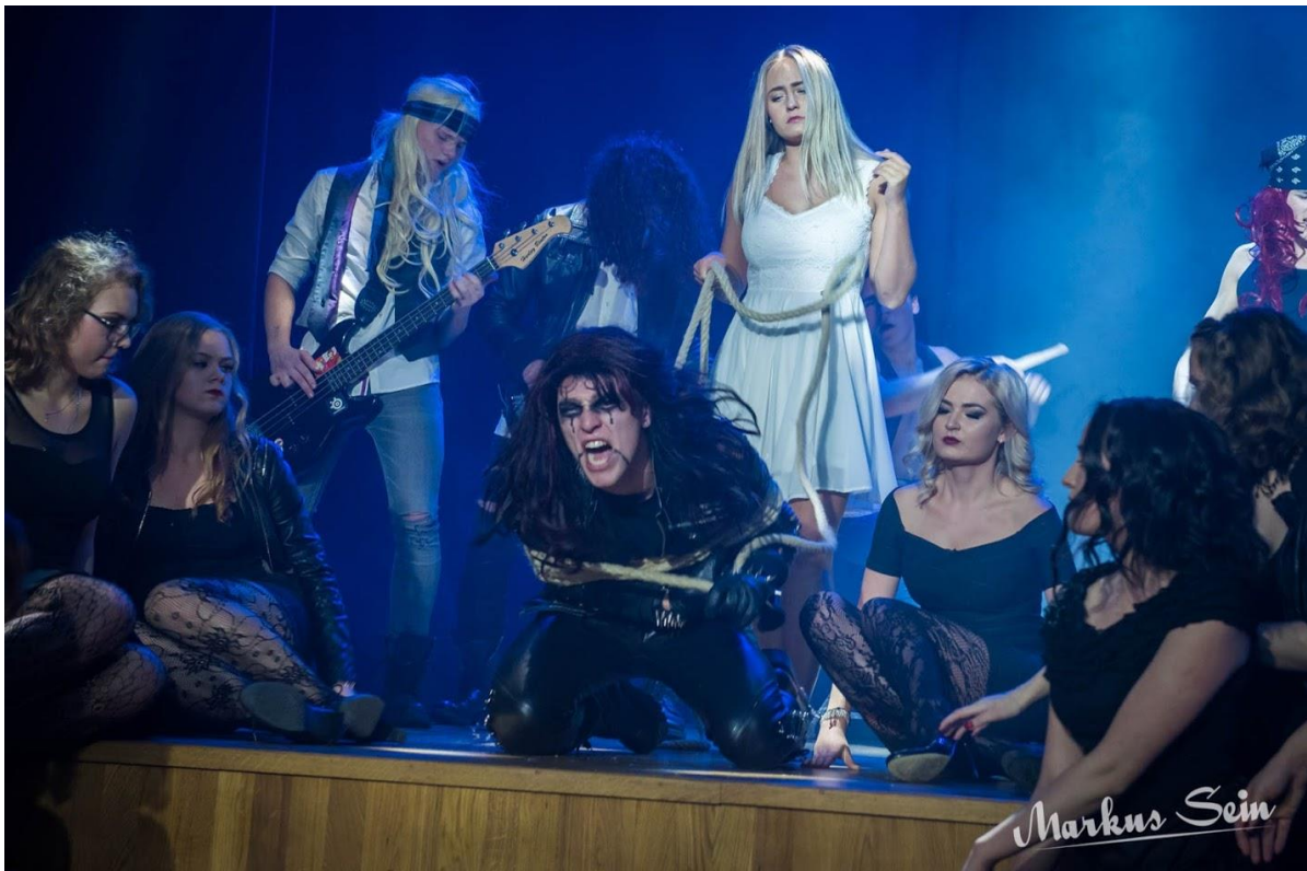
II koht, 11.H ja Alice Cooper „Poison“.