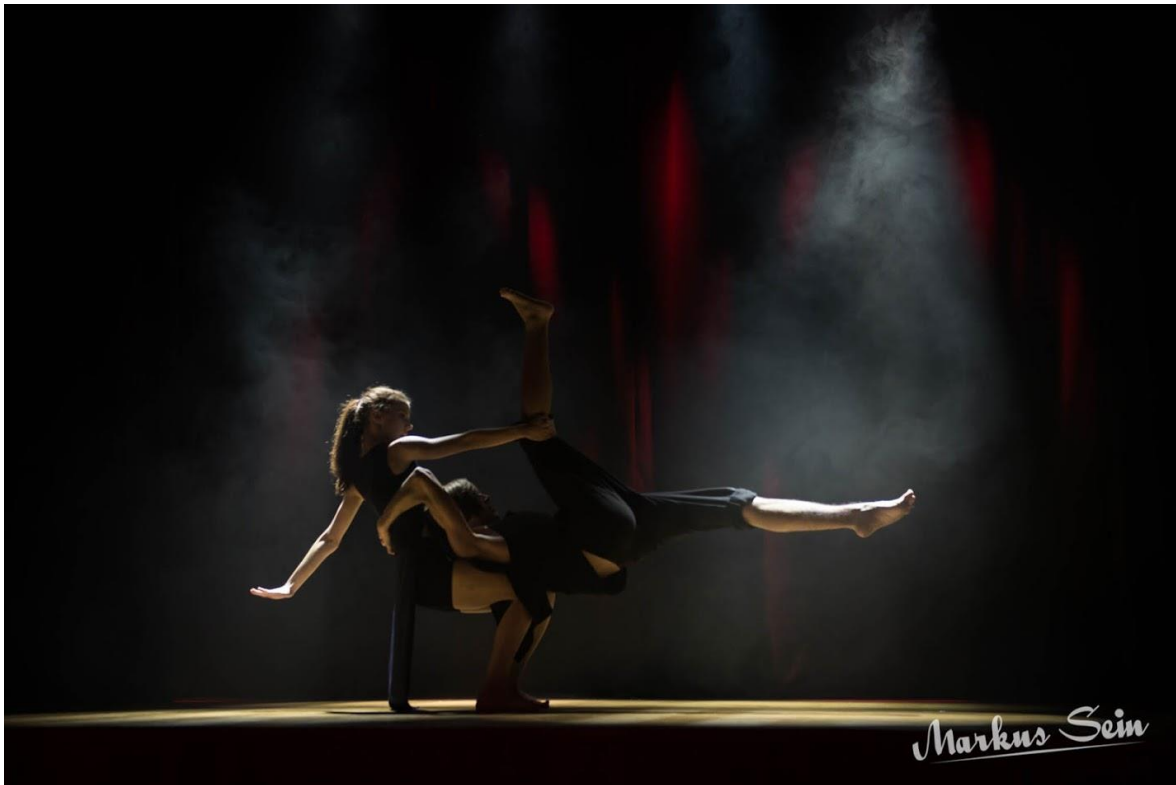
Võidulugu Elisabeth ja Rainis, Pink „Try“