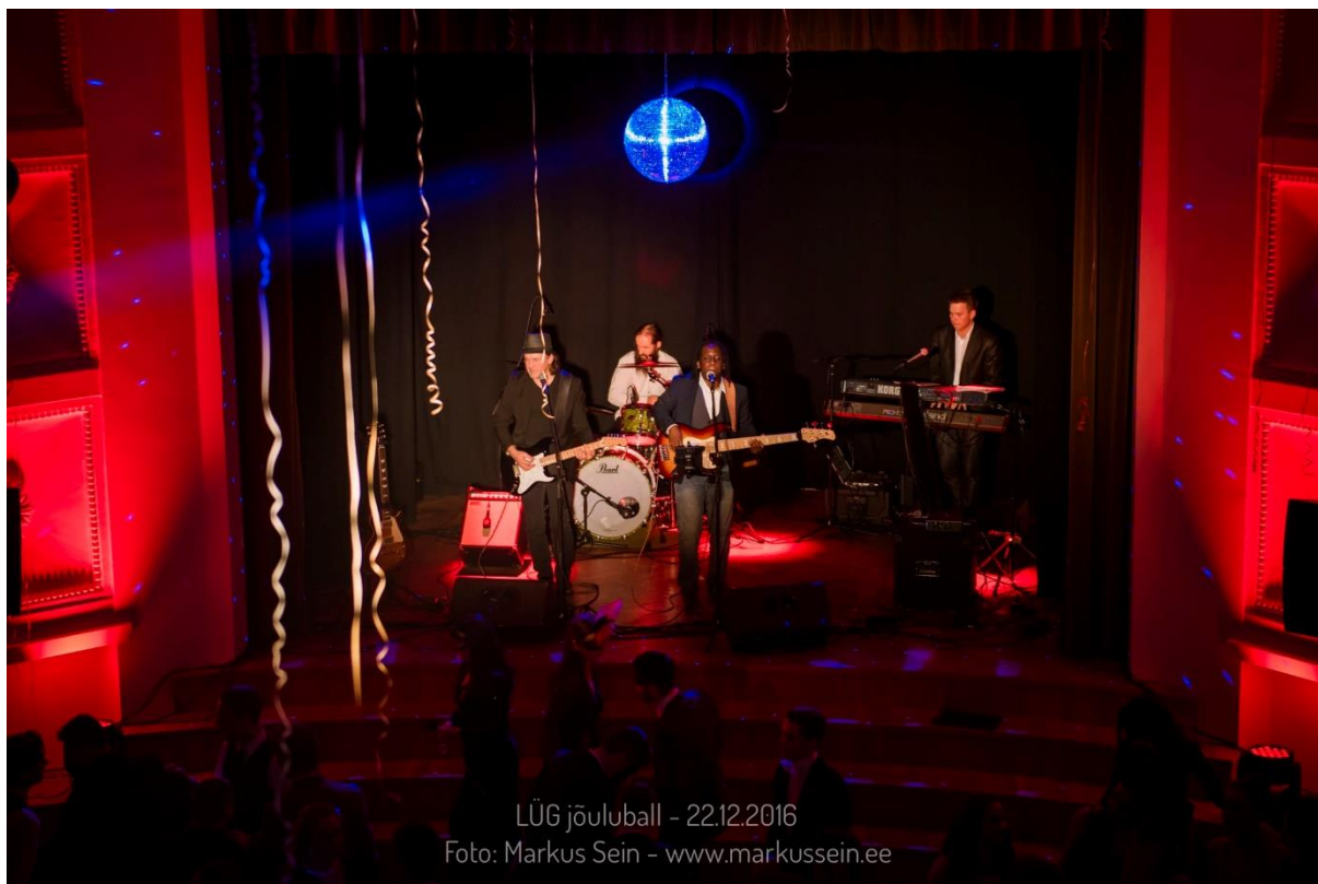
James Werts World Project.