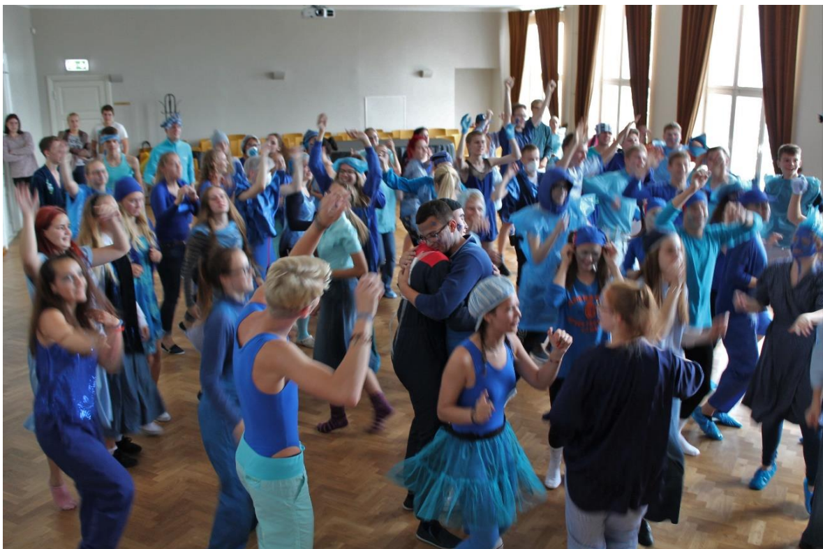
Sinilindude nädala ettevõtmised aulas