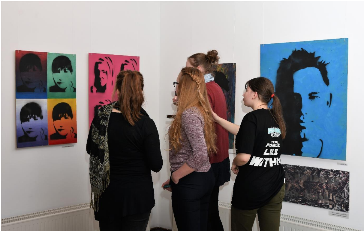
Näituse avamisel.