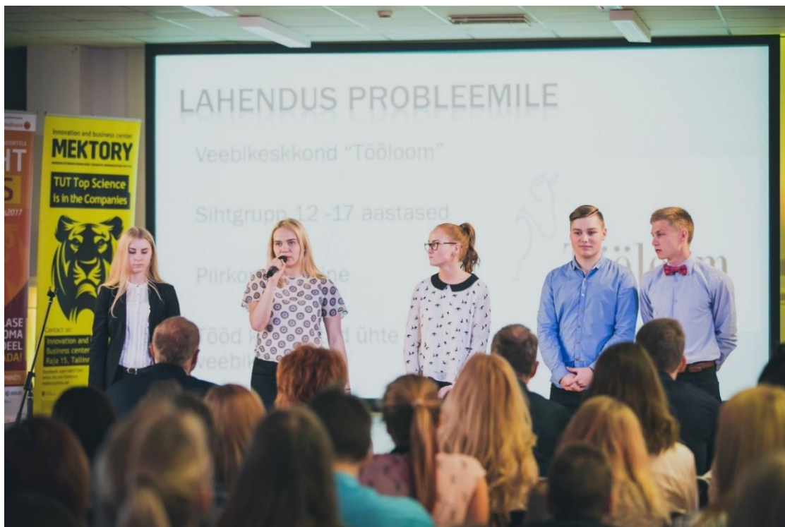
Bright Minds'i finaalüritusel