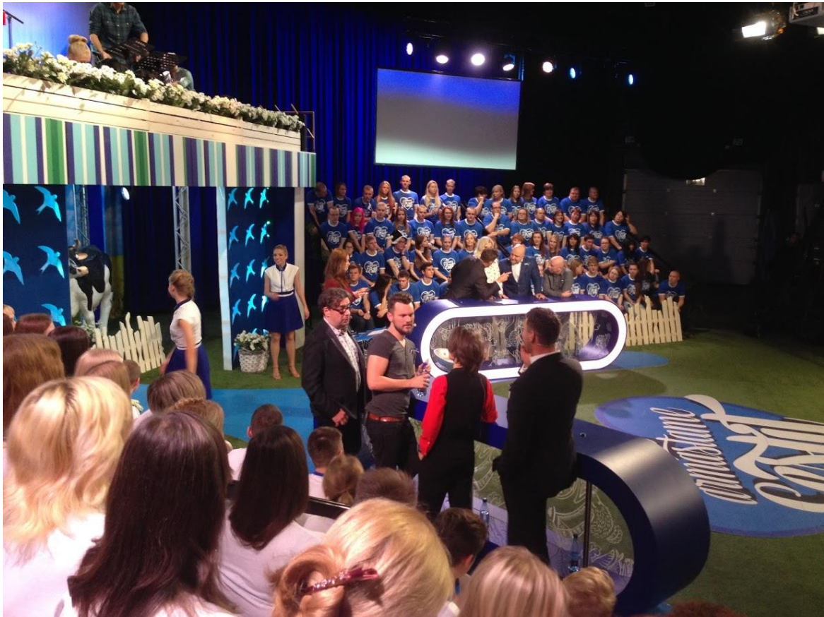
„Me armastame Eestit“ telemängu salvestusel