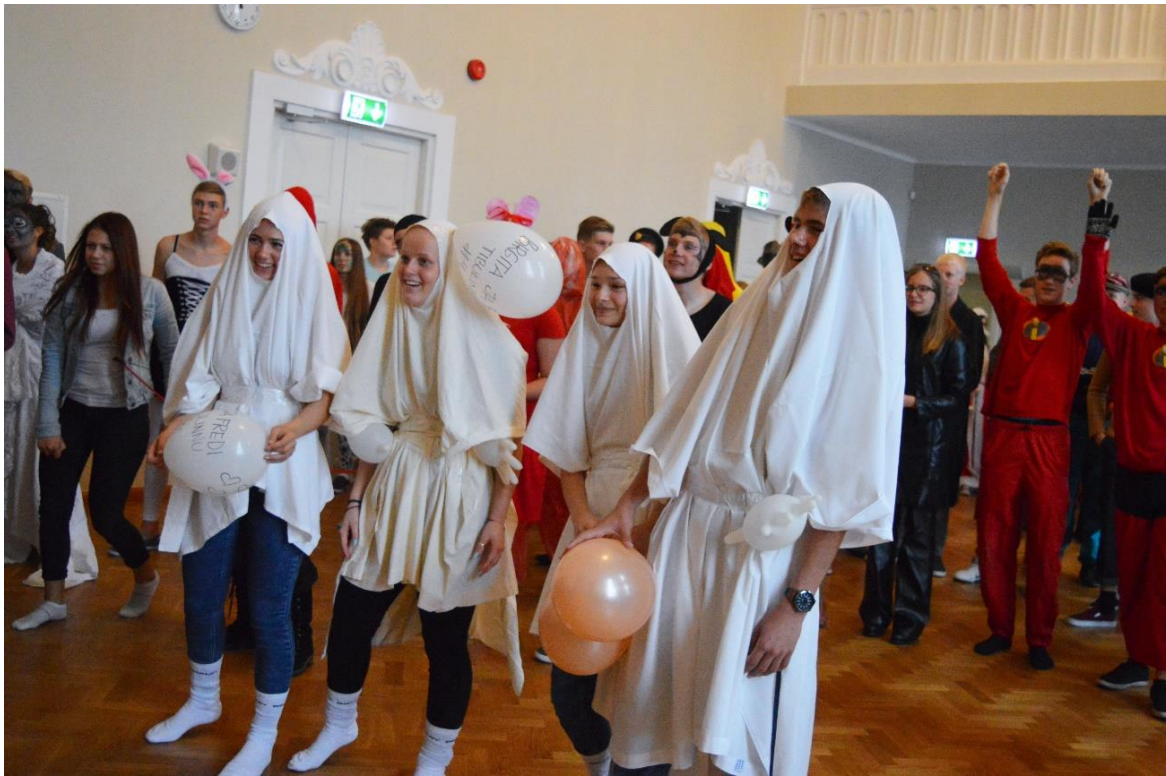
Sinilindude nädala ettevõtmised aulas