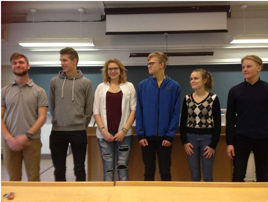
Soome. Tampere konverentsil