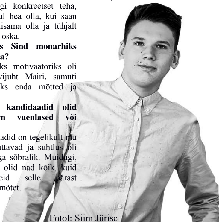
Fotol: Siim Jürise

Ma pole veel nädalatki monarh olnud ja see on väga raske küsimus. Ma arvan, et kohe midagi muutma hakata pole mõtet. Pigem vaadata, probleem üles otsida ning seejärel leida lahendus.