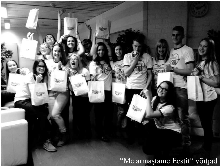
„Me armastame Eestit“ võitjad

minutiga keele suulakke kinnitanud ja palvus meid oma kõrvalistujate külge kleepinud, läks võtte suhteliselt kiiresti – vaid 2 tundi. Stuudios saime teada, et