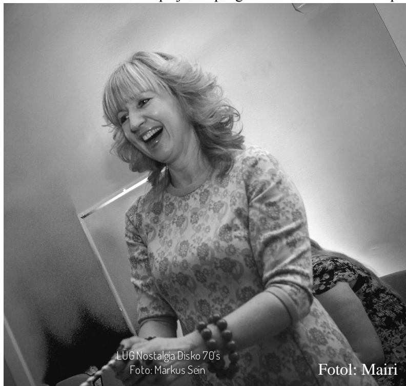
LUG Nostalgia Disko 70's

Päriselu ei alga pärast gümnaasiumi lõpetamist, see juba käib. Vilistlastena kokkutulekul meenutamise ja õhkamise asemel avastage oma kooliga seostuvaid ägedaid asju siin ja praegu.